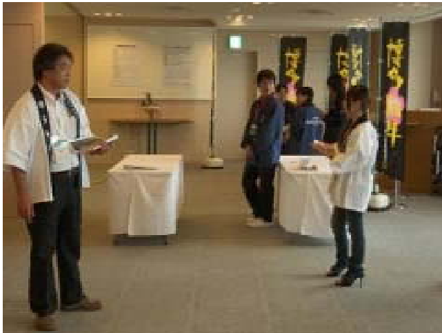
正面左奥からエレベーターでお客様が 上がってきます。