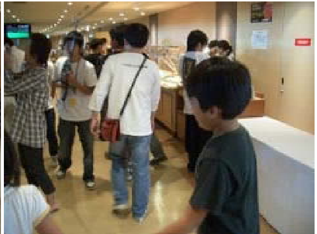
試食に並ぶお客様 かなり込み合います