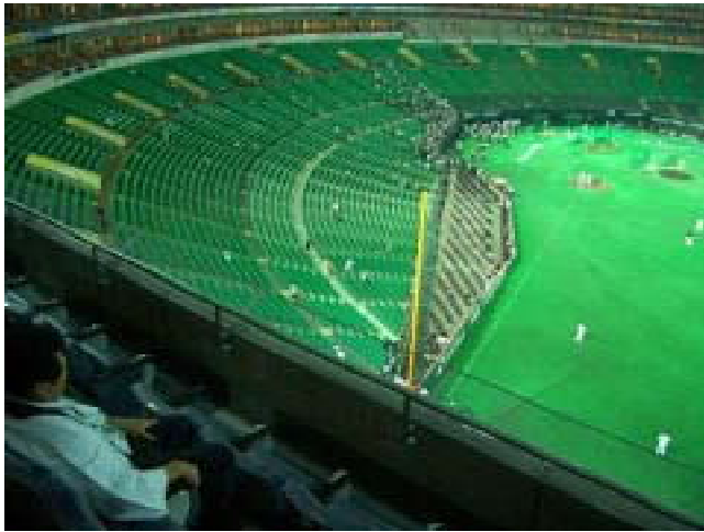
なごみシートからの眺め