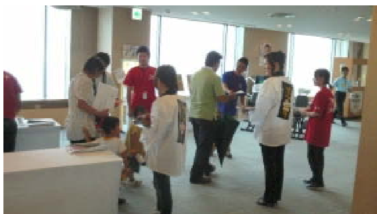
生産者がチラシを配布しています。