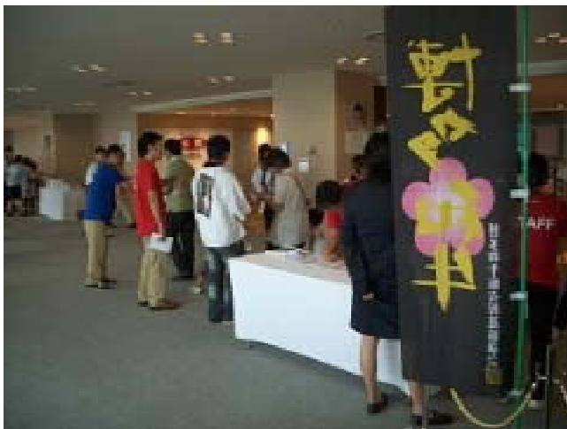
(左) 生産者によるチラシの配布 マッサージ業の「てもみん」も PR していま した

PR 方法としては3日間で延べ750人以上 に博多和牛を知っていただいたイベント となりました。